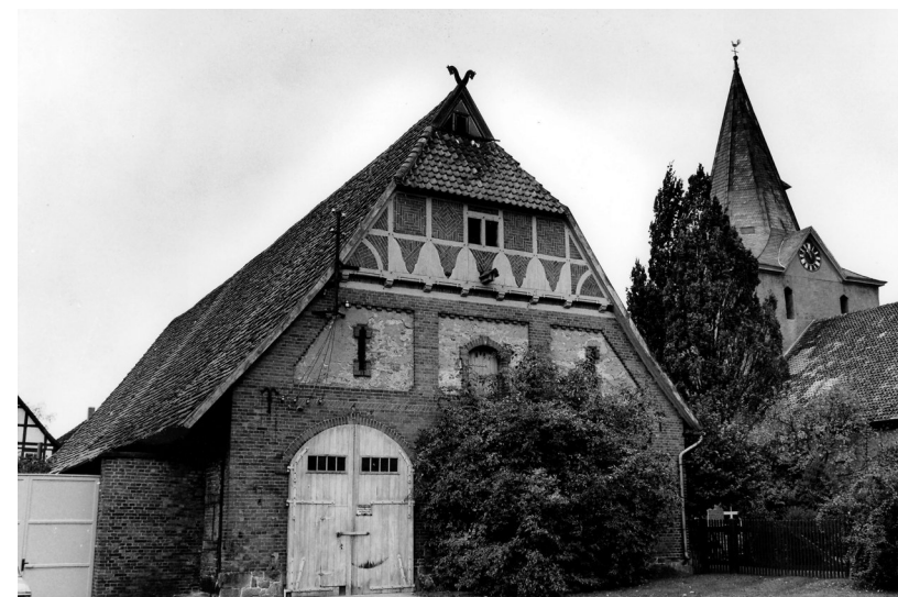
So sah es 1975 noch aus: Die Zehntscheune aus dem 17. Jahrhundert steht neben der Liebfrauenkirche. Später wurde sie demontiert

Am Treffen selbst hat die Truppe offenbar Gefallen gefunden: Schon für das nächste Jahr ist ein weiteres geplant.